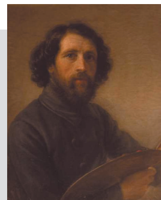
GIOVANNI CARNOVALI detto IL PICCIO "Autoritratto con tavolozza" , 1846-50

Olio su tela, cm. 71x58 Legato Luigi Trécourt, 1882